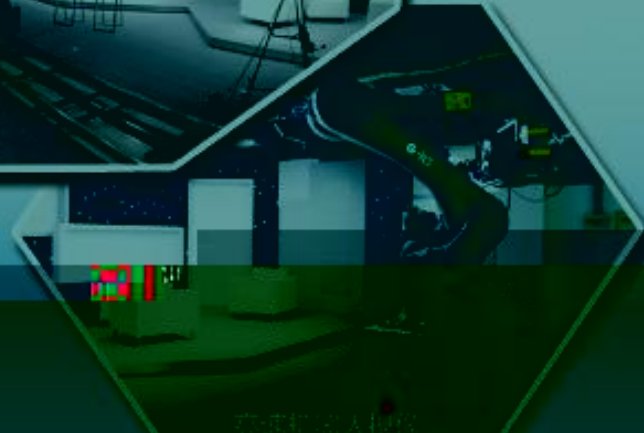
影视多媒体专业实习工坊